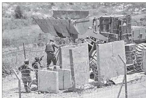
Установка заграждений на границе

мой организации назвали это решение «шокирующим и опасным», а также нацеленным «против палестинского народа и фракции сопротивления». При этом представители ХАМАСа отметили, что решение египетского суда не окажет влияния на движение, поскольку оно «пользуется уважением палестинского народа и лидеров нации».