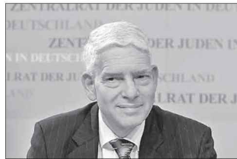
Президент ЦСЕГ Йозеф Шустер

В прошлом году число зарегистрированных преступлений на почве