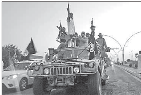
Боевики ИГ в Мосуле

Австралия запретила своим гражданам въезд в Мосул. Австралийские власти запретили своим гражданам въезд в расположенный на севере Ирака Мосул, который сейчас находится под контролем боевиков ИГ. Это решение было принято, чтобы помешать австралийским мусульманам воевать на стороне исламистов.