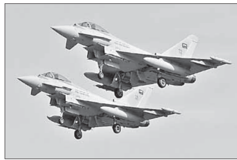
Взлет истребителей саудовских ВВС

«Исламское государство» пригрозило повторить теракты 11 сентября. Боевики группировки «Исламское государство» пообещали повторить теракт 11 сентября 2001 года в Соединенных Штатах. Для этого они распространили в интернете ряд сообщений под единым хэштегом «Мы Снова Сожжем Америку». В них боевики говорят о новых терактах.