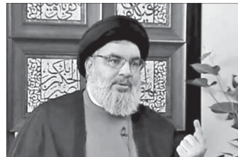
Лидер «Хизбаллы» Х. Насралла

Насралла: скоро будет новая война с Израилем. Лидер «Хизбаллы» Хасан Насралла в интервью сирийскому телевидению заявил, что скоро ждет новой войны, отметив: «Нации региона должны быть готовы принести жертвы в будущем конфликте с Израилем». Он также рас-