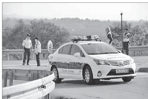
Полиция на месте инцидента под Рамаллой

Убит палестинец, напавший на израильских военных. Днем 8 апреля 27-летний палестинец Мухаммад Ясер Каракара напал с ножом на израильских военных на дороге к северу от Рамаллы. Он успел серьезно ранить одного израильтянина и нанести легкое ранение другому, перед тем как сотрудники службы безопасности застрелили его.