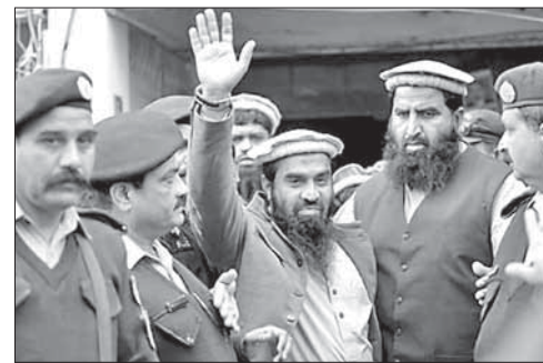
Заки-ур-Рехман Лакхви (в центре) у зала суда

Боевики «Лашкар-э-Тайба» атаковали Мумбаи 26 ноября 2008 года, захватив гостиницы «Тадж-Махал» и «Оберой», а также еврейский общинный центр «Бейс-Хабар». В руках террористов оказались сотни заложников. Освободить их удалось лишь в