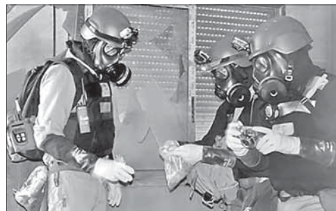
Специалисты ОЗХО контролируют вывоз запасов сирийского химического оружия

Вопрос химического разоружения Сирии особо остро встал после применения данного вида оружия в августе 2013 года в под-