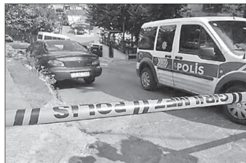
Полиция у здания консульства США в Стамбуле

«Исламское государство» — террористическая группировка, летом 2014 года объявившая «халифат» на части территорий Сирии и Ирака. Против ИГ борются войска, лояльные Дамаску, сирийские повстанцы, иракская армия, шиитские ополченцы, курдские