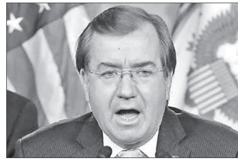
Конгрессмен Эд Ройс

В Конгресс США внесли резолюцию об отклонении «ядерной сделки» с Ираном. В Палату представителей Конгресса США внесен про-