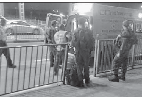
«Скорая помощь» увозит пострадавшего

Нападение на израильтянина. Вечером 9 августа на автозаправке на шоссе 443 в центральной части страны арабский террорист напал на израильтянина и нанес ему колотые ранения. Злоумышленник был застрелен солдатами ЦАГАЛа. Для оказания помощи пострадавшему прибыла «скорая помощь», которая госпитализировала его в клинику «Шаарей цедек» в Иерусалиме.