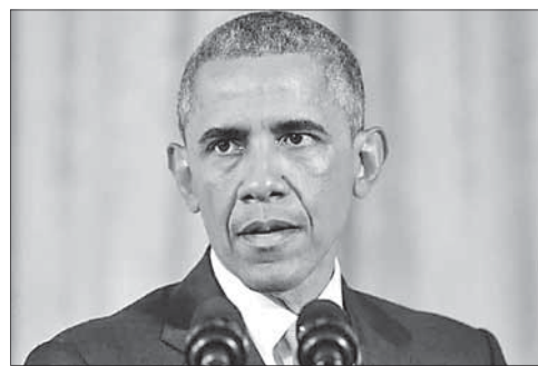
Президент США Барак Обама

силы, чтобы защитить оппозиционные вооруженные формирования, если они будут атакованы сирийскими правительственными войсками или иными группировками. При этом отмечается, что подготовленные войска оппозиции нацелены на борьбу с «Исламским государством».