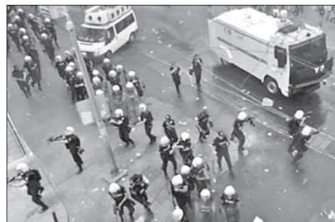
Турецкая полиция на месте теракта

Около 20 человек погибли из-за падения сирийского МиГ-а. Сирийский военный самолет упал в жилом районе захваченного повстанцами города Эриха в Сирии. В результате падения МиГ-а на овощной рынок погибли по меньшей мере 20 человек. Всего в результате этой катастрофы