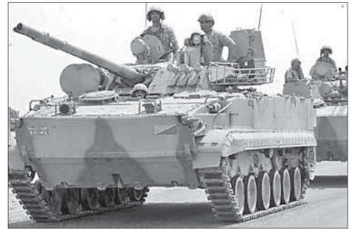
Танки антихоуситской коалиции в Йемене

Египетский миллиардер предложил купить остров для мигрантов. Египетский миллиардер Нагиб