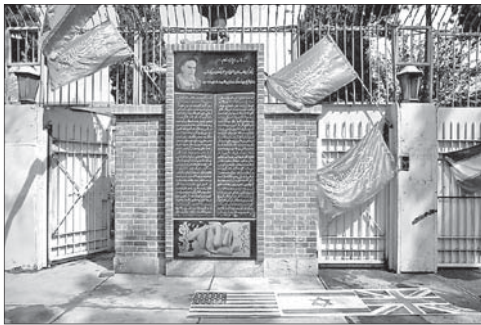
Ворота бывшего посольства США в Тегеране

и Иран достигли договоренности по ядерной программе Тегерана. Соглашение предполагает, что исламская республика обязуется на протяжении пяти лет не обогащать уран до уровня, превышающего 3,67% и преобразовать завод «Фордо» в технологический центр. В обмен на это с Тегерана снимут санкции, которые могут быть