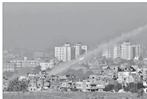
Пуск ракет из сектора Газа

Ракеты, выпущенные палестинцами, попали по своим. Рано утром 2 сентября палестинцы из Газы запустили две ракеты, однако они не долетели до цели, упав на территории сектора. Произошли взрывы, в результате которых ранения получили несколько палестинцев. Израильские СМИ отмечают, что сирена системы предупреждения об обстрелах в этот раз не прозвучала.