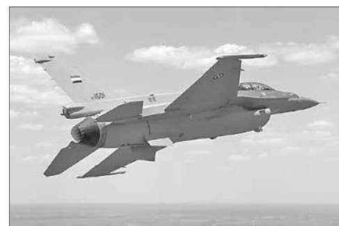
Истребитель F-16 иракских ВВС

Иракские курды обвинили ИГ в применении химического оружия. Иракские кур-