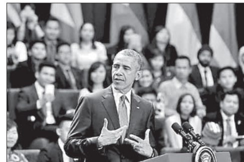
Выступление Б. Обамы на саммите в Малайзии

Обама заявил об укреплении решимости в борьбе с терроризмом. В своем выступлении на региональном саммите в Малайзии президент США Барак Обама осудил нападение боевиков на гостиницу «Рэдиссон блу» в столице Мали Бамако, назвав его «еще одним ужасным напоминанием о зле терроризма». По его сло-