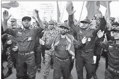
Бойцы иранского корпуса басиджей

Нападении на еврея в Марселе. В Марселе вечером 18 ноября трое неизвестных напали с ножами на шедшего по улице учителя-еврея, нанеся ему несколько ударов. При этом нападавшие выкрикивали в его адрес антисемитские высказывания. На одном из них была футболка с символикой «Исламского государства».