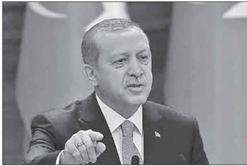
Президент Турции Реджеп Тайип Эрдоган

Между тем, представитель США при НАТО Дуглас Льют заявил, что для создания единой с Россией антитеррористической коалиции в Сирии у Москвы и Вашингтона должны быть общие цели, но пока таковых нет: цель США — победитель террористическую группировку «Исламское государство», а России — поддержать правительство Сирии.