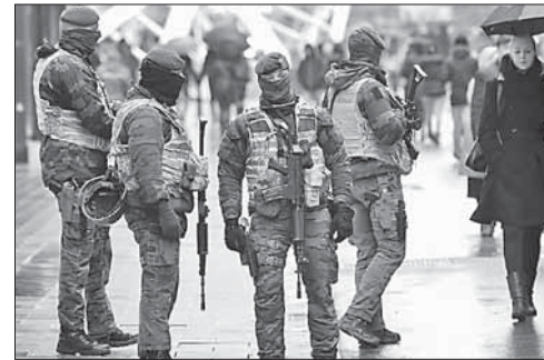
Военные патрулируют улицы Брюсселя

Немецкая полиция отпустила троих подозреваемых в сотрудничестве с ИГ. Задержанные в Берлине подозреваемые в подготовке теракта отпущены на свободу. Они могут быть связаны с террористами «Исламского государства» (ИГ). Полиция предполагает, что подозреваемые могли планировать атаку на Дортмунд, но их отпустили, не обнаружив опасных предметов.