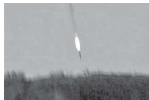
Падение сбитого турками российского Су-24

Российская авиация действует в Сирии с 30 сентября, с прошлого года удары по террорис-