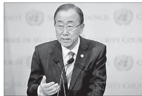
Генеральный секретарь ООН Пан Ги Мун