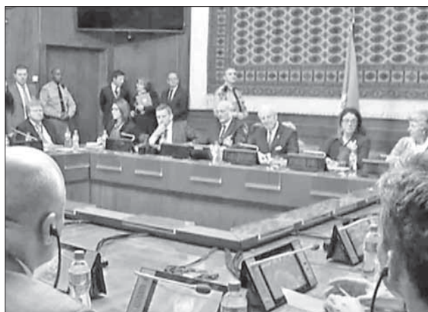
Переговоры по сирийскому урегулированию в Женеве

ли все усилия для возвращения сторон за стол переговоров.