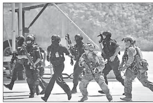
Учения иракских силовиков в Иордании

Генсек НАТО сообщил о начале подготовки иракских силовиков в Иордании. НАТО будет обучать в Иордании иракских силовиков