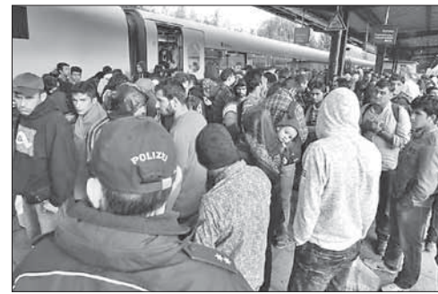
Беженцы в Германии

На сайте аятоллы Хаменеи появилось видео с отрицанием Холокоста. На сайте верховного иранского лидера аятоллы Али Хаменеи появилось видео с отрицанием Холокоста. Оно выложено в Международный день памяти