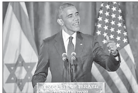
Выступление Б. Обамы в израильском посольстве

28 января стало известно, что США в Ливии могут начать против ИГ военную кампанию в виде авиаударов