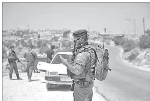
Солдаты на блокпосту в районе деревни Халхул

В тот же день палестинец, вооруженный «коктейлем Молотова», был застрелен израильскими военными в деревне Халхул.