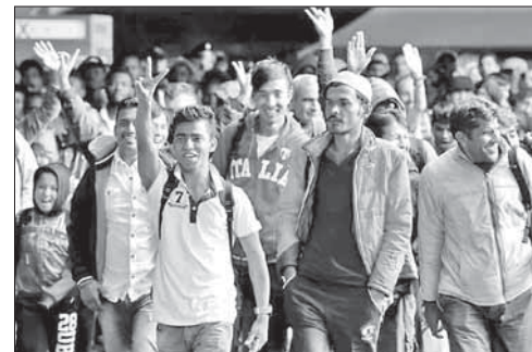
Беженцы на вокзале в Мюнхене

Более половины французов возложили вину за антисемитизм