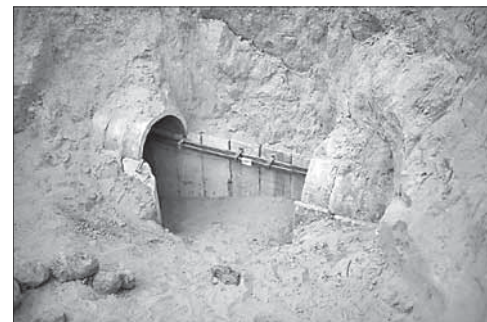
Хамасовский тоннель, обнаруженный ЦАГАЛом

В Ираке убит племянник главаря ИГ. Около города Рамеди в иракской провинции Анбар