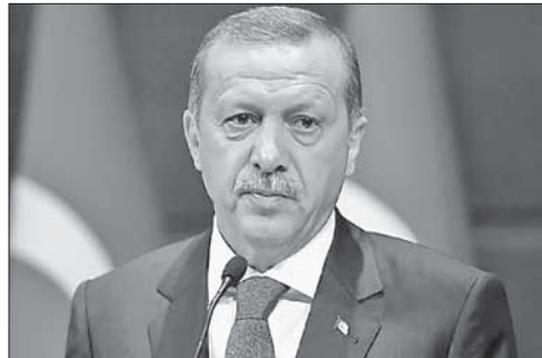
Президент Турции Эрдоган

Сирия обвинила Турцию в артобстреле приграничного района. МИД Сирии заявил, что турецкая армия обстреляла из тяжелой артиллерии приграничный район Джебаль Атера на севере провинции Латакия, что привело к жертвам среди местного мирного населения. Дамаск считает акт обстрела «грубым нарушением норм международного права и преступлением против мирного населения».