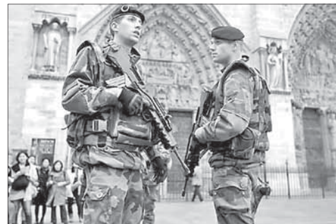
Ноябрь 2015 года. Солдаты на улицах Парижа

В Дании девушку обвинили в подготовке терактов в школах. В Дании 16-летняя девушка обвиняется в планировании терактов в двух школах, одна из которых — еврейская. Девушка, недавно принявшая ислам, добыла химические ингредиенты для изготовления бомб. Предполагается, что на нее повлиял 24-летний друг, ранее воевавший в Сирии. Ему также предъявлено обвинение в соучастии.