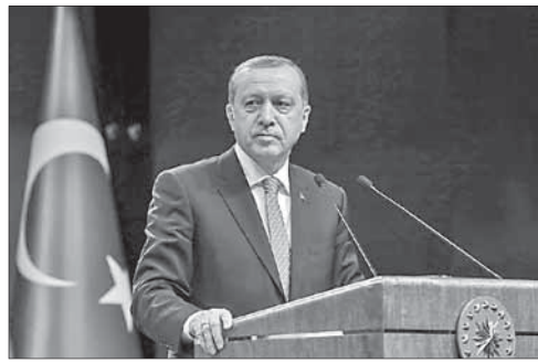
Президент Турции Эрдоган

Президент Турции Эрдоган осудил взрыв в Анкаре и выразил собо-