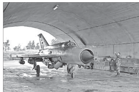
МиГ-21 сирийских ВВС на авиабазе Хама

Попытка теракта в Самарии. 9 марта в расположенном на западе Самарии городе Кдумим вооруженная ножом террористка попыталась напасть на местную жительницу. К счастью, на месте инцидента появился муж предполагаемой жертвы, вооруженный пистолетом. Ему удалось задержать террористку.