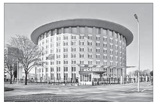
Здание штаб-квартиры ОЗХО в Газае

Турция и США создали разведцентр на сирийской границе. ЦРУ США и Национальная разведывательная организация Турции создали на сирийской границе сов-