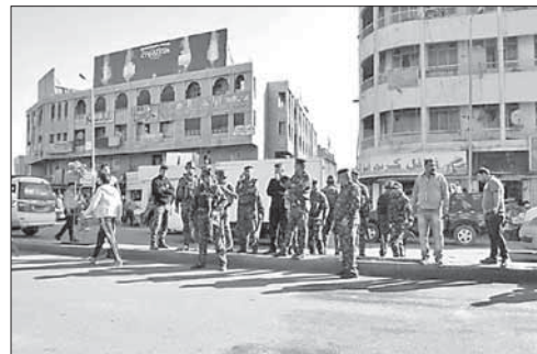
Полиция на месте взрыва в Багдаде

В Багдаде произошел сильный взрыв. В центре Багдада произошел сильный взрыв. По данным местной полиции, в результате теракта погибли три и ранены 27 человек. Целью террориста были сторонники влиятельного шиитского священнослужителя Муктады аль-Садра, собравшиеся