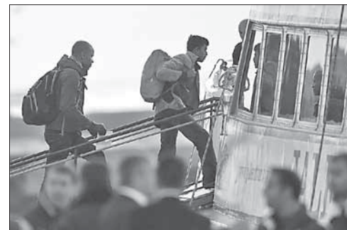
Выселяемые из Греции мигранты

Из Греции выслали первых мигрантов в рамках соглашения с Анкарой. Власти Греции отправили в турецкий порт Дикили две лодки с более чем 130 мигрантами. Это первая депортация в рамках соглашения между Брюсселем и Анкарой о возврате в Турцию нелегалов в обмен на беженцев из Сирии. Оно вступило в силу 4 апреля и предусматривает, что все беженцы, которые придут в Грецию транзитом через Турцию, вернутся на турецкую территорию и будут приняты там.