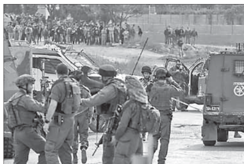
Солдаты ЦАГАЛа на перекрестке Тапуах

Попытка нападения на перекрестке Тапуах. Палестин-