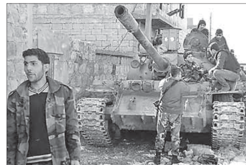
Танк сирийской армии под Алеппо