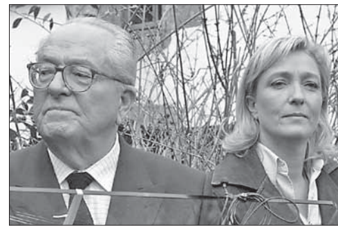
Жан-Мари Ле Пен и его дочь Марин

Жан-Мари Ле Пен предрек до чери поражение на президентских выборах. Основатель «Националь-