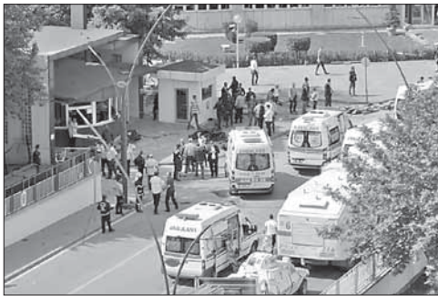
На месте взрыва в Газиантепе

Ранее в тот же день турецкий город Килис, расположенный у границы с Сирией, подвергся ракетному обстрелу — снаряды были выпущены с территории, контролируемой боевиками «Исламского государства». Два человека получили ранения.