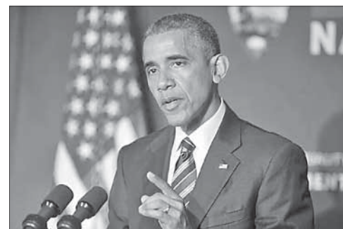
Президент США Барак Обама

Обама одобрил отправку в Сирию 250 военнослужащих. Президент США Барак Обама согласовал отправку в Сирию дополнительного контингента из 250 американских военнослужащих. Они займутся