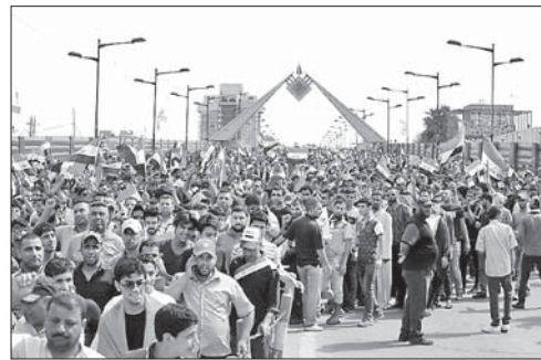
Участники акции протеста в Багдаде

Протесты в Багдаде обернулись штурмом парламента. Стронники лидера иракских шиитов Мук-