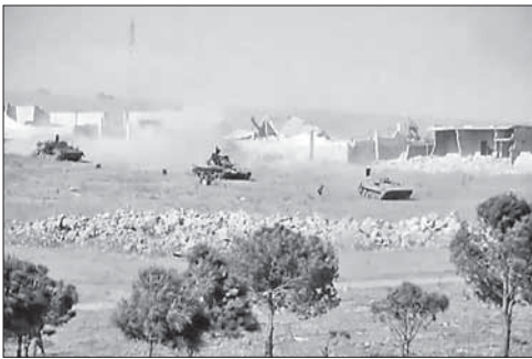
Развалины авиабазы Абу аль-Духор

Удар неизвестных самолетов уничтожил в Сирии полевых командиров «Джебхат ан-Нусры». В результате авиаудара по заброшенной авиабазе Абу аль-Духор на северо-западе Сирии погибли 16 высокопоставленных членов террористической группировки «Джебхат ан-Нусра», которая является отделе-