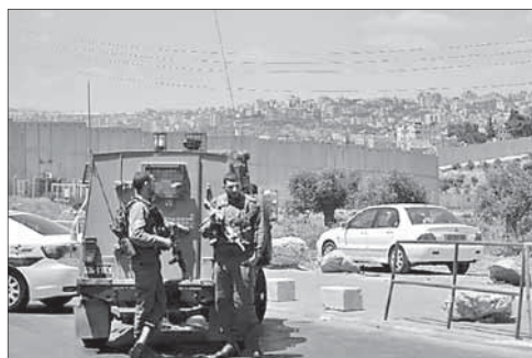
Солдаты на КПП на въезде в Иерусалим

Террорист в полицейской форме готовил атаку в Иерусалиме. Вечером 14 мая израильские силы безопасности предо-