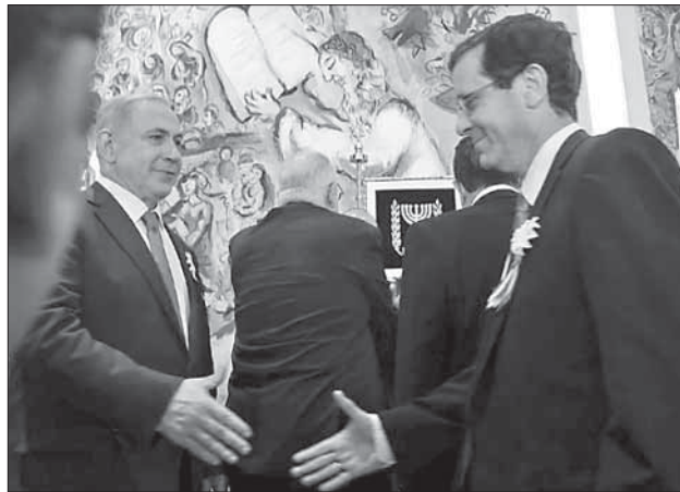
Биньямин Нетаниягу (слева) и Ицхак Герцог

Высокопоставленные представители «Ликуда» объясняют этот шаг Нетаниягу тем, что тот хотел припугнуть Герцога, показав тому, насколько проблематичным является электоральное положение его партии, и что именно поэтому Герцогу стоит вступить в правительственную коалицию. Герцог, который в последний период чувствует себя крайне неуверенно, действительно был очень встревожен и усилил давление на своих соратников по партии, которые выступают против присоединения «Сионистского лагеря» к правительству Не-