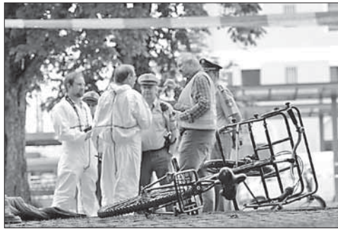
Полиция и медики на месте нападения в Граффинге

Пентагон рассказал о крахе государственности ИГ. Террористы «Исламского государства» не смогли создать на захваченных землях полноценное государственное образование. Такую точку зрения в ходе брифинга для прессы высказал официальный представитель группы войск США, участвующий в операции в Ираке и Сирии, полковник Стив Уоррен. «Так называемый «халифат» ИГ опирается на свою возможность существовать в виде государства. Факт заключается в том, что они не могут этого делать», — сказал Уоррен, напомнив, что ВВС США прове-