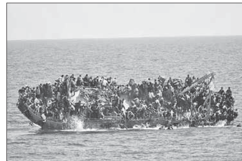
Лодка с беженцами у берегов Италии

В Средиземном море за неделю утонули более 700 мигрантов. По данным Управления Верховного комиссара ООН по делам беженцев, за последние несколько дней в Средиземном море утонули более 700 человек, пытавшихся добраться до берегов Европы. Крупнейшая катастрофа произошла 26 мая, когда