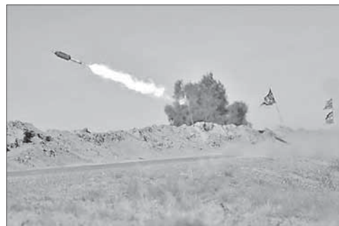
Обстрел позиций ИГ под Фаллуджей

Иракская армия начала штурм Фаллуджи. Иракская армия начала непосредственный штурм города Фаллуджа. Это следующая стадия операции по освобождению населенного пункта