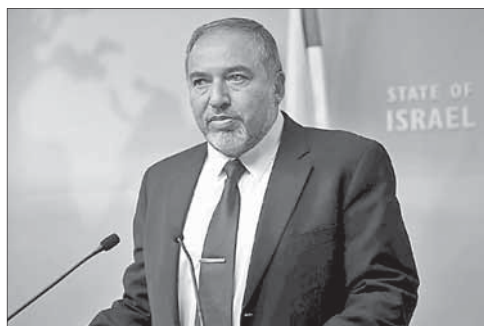
Министр обороны Израиля Авигдор Либерман

Кроме Либермана, обновлены портфели и другие политики —