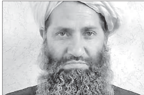
Новый глава «Талибана» Хайбатулла Ахундзаде

Фаллуджа расположена в западной провинции Анбар. Город находится под контролем ИГ с 2014 года и считается одним из крупнейших оплотов террористов на территории Ирака.