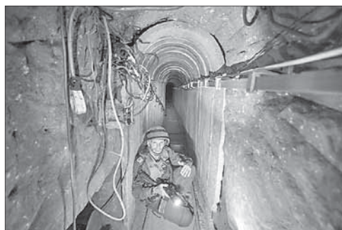
Израильский солдат в хамасовском тоннеле

Нападения продолжают-ся. Вечером 30 мая палестинский террорист атаковал израильского солдата в Тель-Авиве. Военнослужащий получил легкое ранение отверткой в голову и был эвакуирован в госпиталь. Террорист бежал и скрылся в подвезде одного из близлежащих домов. Он был найден и задержан прохожими, которые передали его полиции.