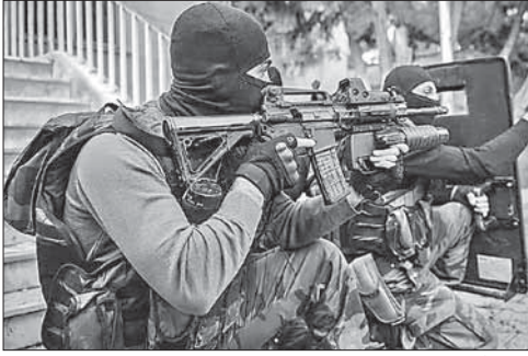
Контртеррористическая операция в Нусайбине

От боевиков ИГ освободили город на востоке Ливии. Военные формирования, охраняющие нефтяные объекты на востоке Ливии, освободили от боевиков террористической группировки «Исламское государство» город Эн-Науфалия. По