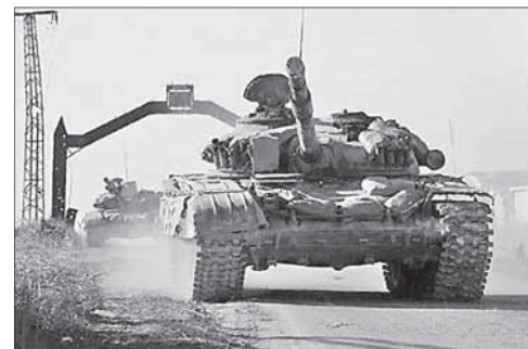
Танки на улицах Алеппо

С мая в Сирии наблюдается активизация боевиков группиро-