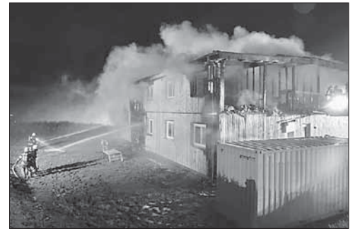
Тушение пожара в лагере беженцев в Австрии

Масштабный миграционный кризис разразился в Евросоюзе в 2015 году. За прошлый год в Европу прибыли более миллиона человек. Лагерь