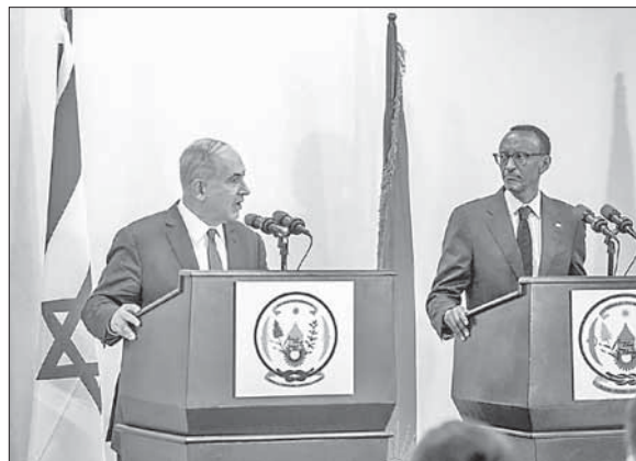
Б. Нетаниягу (слева) и президент Руанды Поль Кагаме

израильское руководство обязано упрочить свои отношения с африканскими странами с целью улучшения своего геополитического статуса в мире.