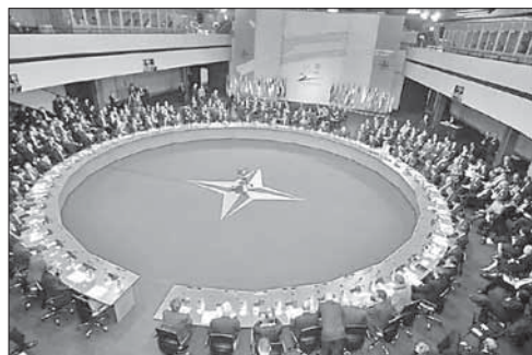
Саммит НАТО в Варшаве