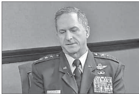
Генерал Дэвид Гольдфайн

В результате взрывов у аэропорта в Йемене погибли 10 человек. По меньшей мере 10 человек