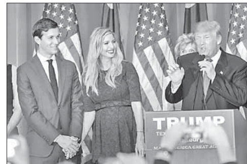
Дональд Трамп (справа) с дочерью и зятем

В своей колонке в газете «Нью-Йорк обсервер» Кушнер вспоминает, что его бабушке удалось бежать из Новогрудского гетто вместе с другими евреями, которые прокопали подземный ход в лес, однако ее брат во время побега был застрелен немцами. «Моя бабушка убежала в лес, где вступила в еврейский партизанский отряд братьев Бельских. Там она и познакомилась с моим дедушкой, сбегавшим из концлагеря», — написал он.