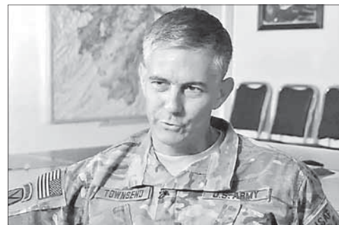
Генерал Стивен Таунсенд

Курды подорвали автомобиль у КПП на юго-востоке Турции. Курдские боевики взорвали начиненный взрывчаткой автомобиль на КПП в турецкой провинции Мардин на юго-востоке страны. Два человека погибли, еще десять, среди которых есть гражданские, получили ранения. После перестрелки с турецкими военными нападавшие скрылись.