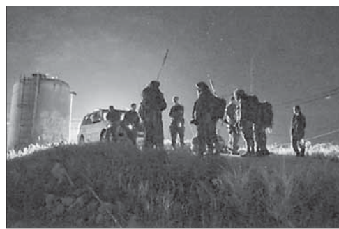
Солдаты у обстрелянной террористами машины