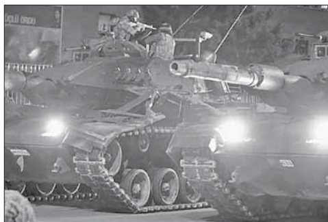
Танки на улицах Анкары

Вечером в пятницу, 15 июля, группа военных пыталась захватить власть в Турции (на улицах Анкары и Стамбула стреляли, гремели взрывы, была введена тяжелая техника), однако государственный переворот удалось предотвратить. 17 июля правительство объявило о подавлении мятежа.