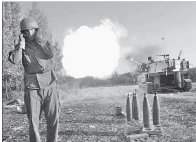
Артиллерия ЦАГАЛа ведет огонь по позициям «Хизбаллы»

рушения в местах проживания шиитского населения Ливана... Все же, «Хизбалла» извлекла уроки из войны и увеличила свой ракетный арсенал. В канун Второй ливанской войны она располагала 12–18 тысячами ракет. Сегодня в ее арсенале около ста