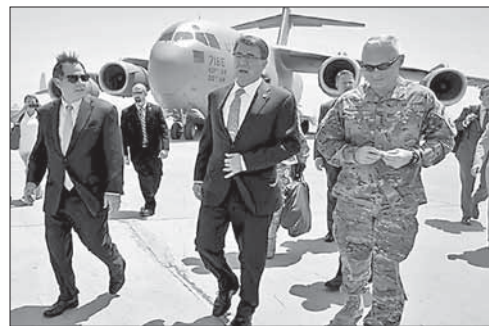
Эштон Картер (в центре) прилетел в Багдад

США перебросят в Ирак дополнительные силы. Соединенные Штаты перебросят в Ирак дополнительные силы. Как заявил министр обороны США Эштон Картер во время визита в Багдад, в ближайшее время в Ирак придут 560 американских военнослужащих. Им предстоит превратить недавно отбитый у боевиков аэродром Кайяра в логистический центр. «Мы должны создать там базу, чтобы предоставлять иракцам необходимую поддержку», — рассказал Картер. — Аэродром