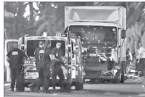
Полицейские у машины террориста в Ницце

Посол Саудовской Аравии в США Абдалла аль-Сауд заявил, что Эр-Ри-