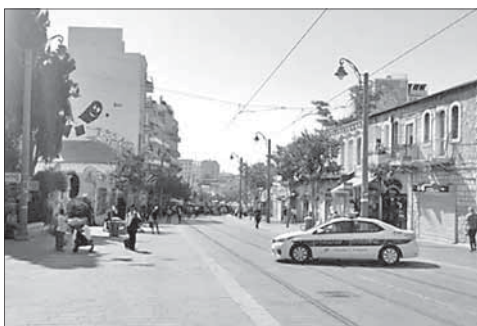
Полицейская машина на месте инцидента в Иерусалиме

Сотрудники службы безопасности трамвая заметили подозрительного араба на углу улиц Яффо и Кинг Джордж. Они его остановили и во время обыска обнаружили в его рюкзаке самодельное взрывное ус-