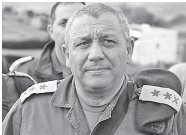
Начальник Генштаба ЦАГАЛа Гади Айзенкот

обществе. Однако его заместитель внес значительный вклад в политизацию армейской сферы. Речь Яира Голана во время церемонии, посвященной Дню Катастрофы, неожиданным образом получила одобрение экс-министра обороны Моше Яалона. Грустное окончание этой истории известно всем. Впервые в истории ЦАГАЛа действия высшего армейского офицера стали причиной вынужденной отставки министра обороны. Вместо того чтобы извиниться и выразить сожаление, Яир Голан произнес