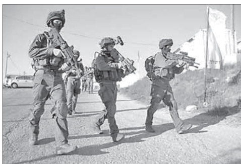
Израильские солдаты на въезде в Шхем