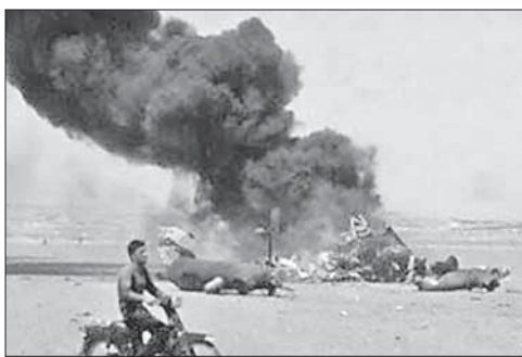
Место падения сбитого российского вертолета

ИГ взяло ответственность за взрыв в немецком Ансбахе. Террористическая группировка «Исламское государство» взяла на себя ответственность за самоподрыв смертника в немецком городе Ансбах. От взрыва, прогремевшего вечером 24 июля возле ресторана «Ойгенс», погиб только сам террорист, 12 человек получили ранения.