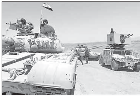
Иракские военные на подступах к Мосулу

Власти Ирака сообщили о бегстве командиров ИГ из Мосула. Командиры «Исламского государства» бегут из города Мосул, который считается иракской «столицей» ИГ. Об этом, ссылаясь на данные разведки, рас-