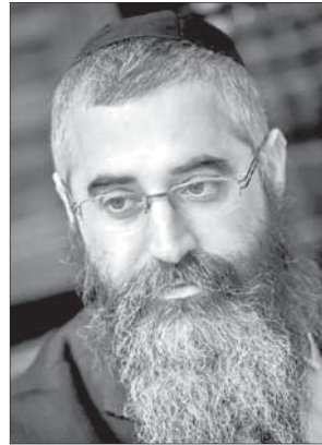
Рав Авроом Вольф, главный раввин Одессы и Юга Украины

Пишите мне: zhblinder@gmail.com , читайте посты в Twitter: @zhblinder и в ЖЖ: http://zvika.livejournal.com/