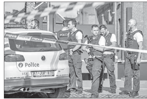
Полицейские на месте нападения в Шарлеруа

Вооруженный мачете мужчина (гражданин Алжира с криминальным прошлым, проживавший в Бельгии с 2012 года) с криками «Аллах акбар!» набросился на сотрудниц правоохранительных органов возле полицейского участка 6 августа. Он успел нанести им несколько ударов, после чего его за-