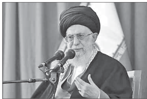
Аятолла Али Хаменеи

В Дании предложили ввести комендантский час для мигрантов. Группа депутатов датского парламента предложила ввести комендантский час для постояльцев центров размещения беженцев. Правительство заявило, что готово рассмотреть эту идею. Инициатива связана с задержанием пятерых мигрантов, подозреваемых в сексуальных домогательствах и изнасиловании.