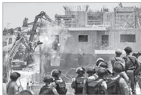
Снос дома одного из террористов

Армия заявила, что снос домов двоюродных братьев Мухаммеда и Халеда Махмаров был осуществлен по приказу политичес-