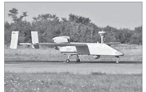
Российский БПЛА «Форпост»

Боевики объявили о начале операции по захвату Алеппо. Исламистская группировка